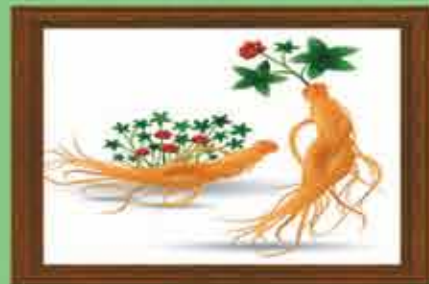
Ginseng 150 mg