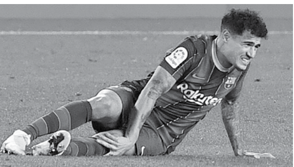
‘ကျွန်တော်တို့အသင်းမှာ ကစားသမားတွေ ဒဏ်ရာပြဿနာနဲ့ ရင်ဆိုင်နေရပါတယ်။ အသင်းရဲ့ အဓိကကစားသမားဖြစ်တဲ့ မက်ဆီ

ကော်တင်ဟိုသည် ဒီဇင်ဘာ ၃၀ ရက် နံနက်ပိုင်းက စပိန်လာလီဂါ ပွဲစဉ်(၁၆)အဖြစ် ဘာစီလိုနာအသင်းက အီဘာအသင်းကို အိမ်ကွင်း၌ တစ်ဂိုးစီ သရေကျခဲ့သည့်ပွဲတွင် ဒူးဒဏ်ရာရရှိခဲ့ခြင်းဖြစ်သည်။ ကော်တင်ဟိုရရှိခဲ့သည့် ယင်းဒဏ်ရာမှာ အစပိုင်းက ပြင်းထန်မှုမရှိဟု ယူဆခဲ့သော်လည်း လက်ရှိအချိန်တွင် အဆိုပါဒဏ်ရာမှာ ခွဲစိတ်ကုသရတော့မည်ဖြစ်ခြင်းကြောင့် ၎င်းကစားသမားသည် အသင်း၏ ပွဲစဉ်အတော်များများကို လွဲချော်ရတော့မည်ဖြစ်သည်။