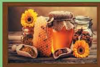
Royal Jelly 150 mg