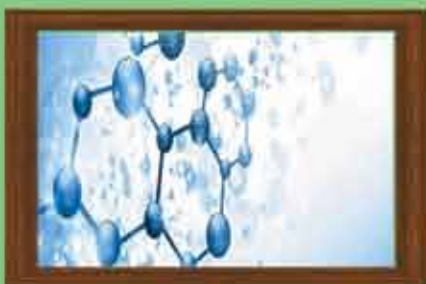
Collagen 300 mg

ဒူးနာ ခါးနာသူများ၊ အရိုးကျိုးပေါင်းတက်နေသူများ၊ အဆစ်အမြစ်ကိုက်ခဲနေသူများနှင့် ကိုယ်ခံစွမ်းအားကို ပိုမိုအားကောင်းစေနိုင်အောင် အသုံးပြုနိုင်သည်