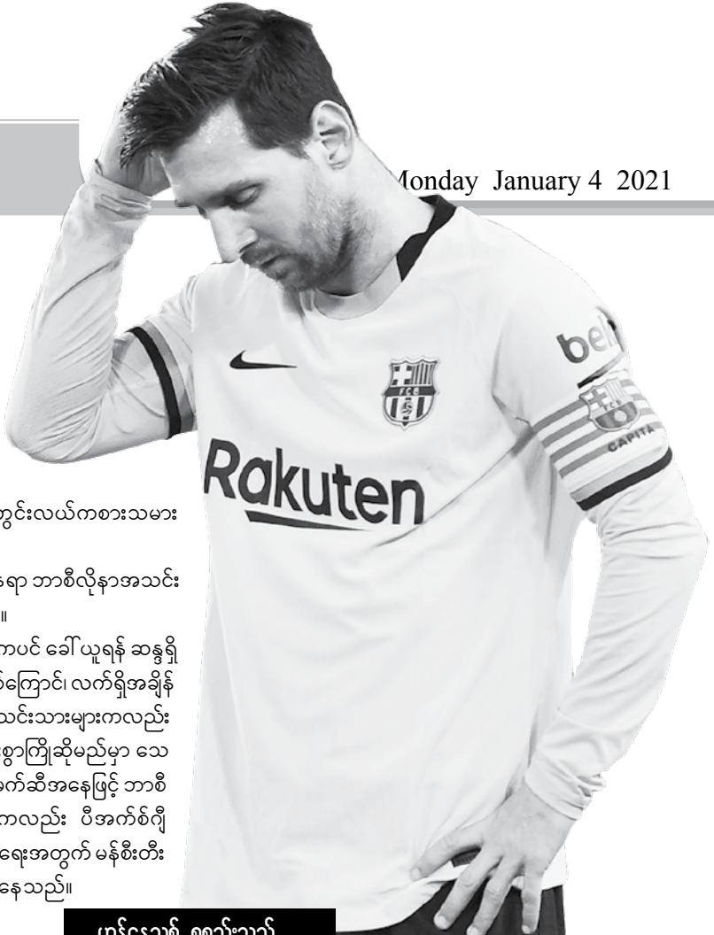
ဟန်နေသစ် စုစည်းသည်

ပိုချက်တီနိုက မိမိအနေဖြင့် မက်ဆီကို ခေါ်ယူရန် ယခုမှ စိတ်ဝင်စားခြင်းမဟုတ်ဘဲ မိမိ စပါးအသင်းကို ကိုင်တွယ်စဉ်ကပင် ခေါ်ယူရန် ဆန္ဒရှိခဲ့ကြောင်း၊ ယင်းအချိန်က မက်ဆီကို ခေါ်ယူရန်မှာ ဝန်နှင့်အားမမျှသလို ရှိခဲ့ခြင်းကြောင့် အားမတန်၍ မာန်လျှော့ခဲ့ရခြင်းဖြစ်ကြောင်း၊ လက်ရှိအချိန်တွင်မူ မက်ဆီသာ ပီအက်စ်ဂျီအသင်းသို့ ပြောင်းရွှေ့ရန်ဆန္ဒရှိပါက ခေါ်ယူရန် အဆင်သင့်ဖြစ်ရှိနေပြီကြောင်း၊ ပီအက်စ်ဂျီ အသင်းသားများကလည်း မက်ဆီသာလာမည်ဆိုပါက နွေးထွေးစွာကြိုဆိုမည်မှာ သေချာကြောင်းပြောဆိုခဲ့သည်။ သို့သော် မက်ဆီအနေဖြင့် ဘာစီလိုနာအသင်းမှ ထွက်ခွာမည်ဆိုပါကလည်း ပီအက်စ်ဂျီအသင်းသည် ၎င်းကစားသမားကို ရရှိရေးအတွက် မန်စီးတီးအသင်းနှင့် အပြိုင်ကမ်းလှမ်းရဖွယ်ရှိနေသည်။