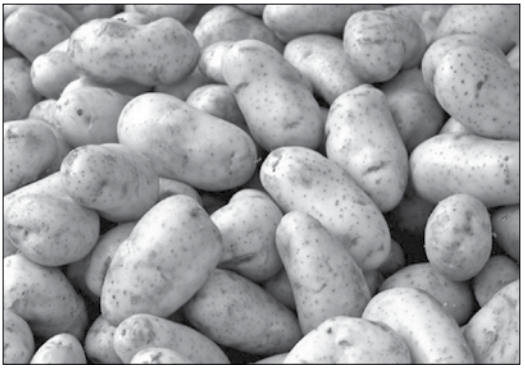
ပိဿာဝင်ရောက်ခဲ့ကြောင်း ကုန်စည်ဒိုင်ဈေးကွက်မှ သိရသည်။ ရွှေဝါထွန်း(မြင့်တင်ပြည်တွင်း-ရန်ကုန်)

ဘုရင့်နောင်ကုန်စည်ဒိုင်သို့ တရုတ်အလူး(အသစ်) နှင့် ရှမ်းပြည်နယ် အောင်ပန်းမြို့မှအလူးများ ဝင်ရောက်လျက်ရှိပြီးဒီဇင်ဘာ ၂၉ရက်တွင် တရုတ်အလူး(အသစ်)တစ်ပိဿာ ဈေးမှာ ကျပ်၅၅၀ ဖြစ်ပြီး အောင်ပန်းမြို့မှ ဝင်ရောက်လာသော အလူးတစ်ပိဿာ ဈေးနှုန်းမှာ အလူး A1 ကျပ် ၃၈၀၊ အလူး OK ကျပ် ၄၇၀၊ အလူး S1 ကျပ် ၅၇၀၊ အလူး S2 ကျပ် ၆၅၀ ဈေးနှုန်းအသီးသီးဖြစ်သည်။ ရန်ကုန်မြို့ဒေသအတွင်း လက်လီပြန်လည်ရောင်းချသူများနှင့် အလူးကြော်လုပ်ငန်းရှင်များက ဝယ်ယူခဲ့ကြကြောင်း၊ ဘုရင့်နောင်ကုန်စည်ဒိုင်သို့ ဒီဇင်ဘာ ၂၉ ရက် အလူးဝင်ရောက်မှုမှာ တစ်နေ့လျှင် ပျမ်းမျှကားအစီး အရေအတွက် ၁၂ စီးခန့်နှင့်တစ်နေ့လျှင်ပျမ်းမျှပိဿာချိန် ၇၂၀၀၀