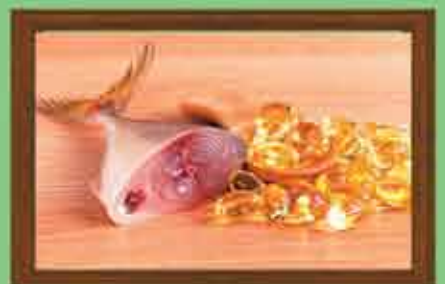
Fish Oil 50 mg